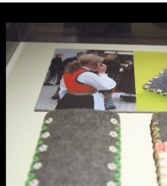
ROSÉ DE BEER: Smart pone sleeve hardanger