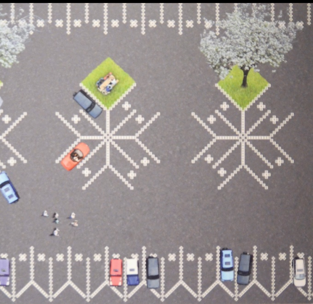
Hardanger parking lot