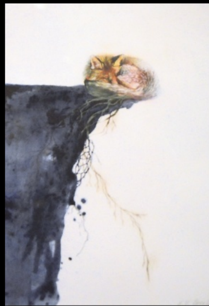
ELS GEELLEN: Balance

Isbjørn og moskus i «ny drakt» har funne vegen til veggane. Kystlandskap frå nord i Noreg også. Dit var det mange hardingar som reiste sjøvegen, så det høyrer heime her det og.